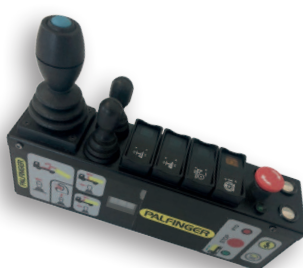
Pro Active Drive