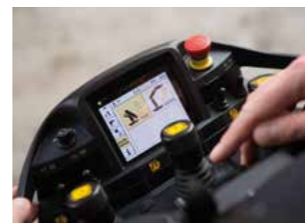
P-FOLD Perfekt gerüstet auf Fingerdruck

Das Dual Power System ermöglicht vielseitige Einsatzmöglichkeiten. So sind Arbeiten mit hoher Reichweite aber auch der Schwerlastbetrieb jederzeit möglich.