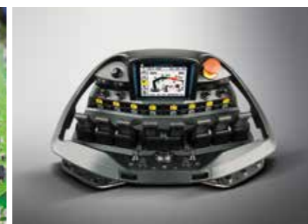
PALcom P7 Im Dialog mit dem Anwender

Zu den wichtigsten Funktionen der PAL-TRONIC zählt das S-HPLS. Ein vollautomatisches System zur Hubkrafterhöhung. Je nach Bedarf erfolgt eine kontinuierliche Anpassung der Hubkraft und Geschwindigkeit des Kranes.