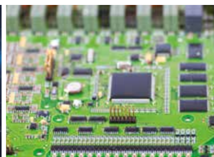
S-HPLS Mehr Hubkraft wenn's drauf ankommt

HPSC-Plus bietet drei Module zur Erweiterung des bewährten Standsicherheitsystems HPSC. Durch Beladungserkennung, Längenmessung oder Stützkrafterfassung kann die Hubleistung maximal ausgeschöpft werden.