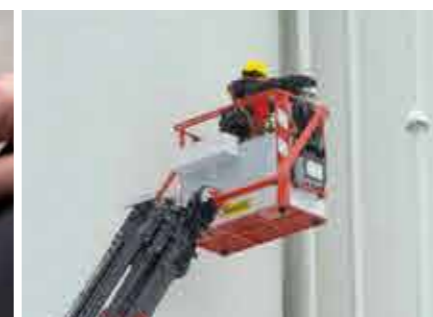
Arbeitskorb Ein Maximum an Funktionalität

Das neue Assistenzsystem macht das Auseinanderlegen und Zusammenlegen für den Bediener zu einem Kinderspiel. Die Rüstzeit verringert sich dadurch auf ein Minimum.