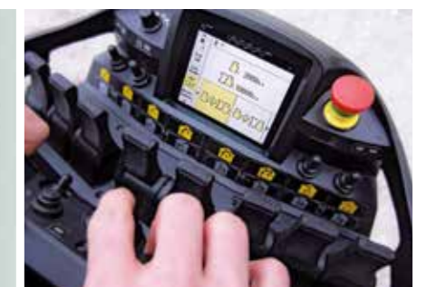
MEXT und WEIGH Systeme für einfacheres Handling

Mit dem Arbeitskorb können zusätzliche Arbeiten wie Installationsarbeiten oder Wartungsarbeiten durch den Kran erledigt werden.