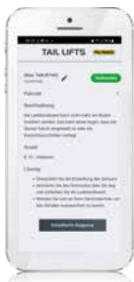
Anzeige des vorliegenden Fehlers, z.B. Fehlercode 3