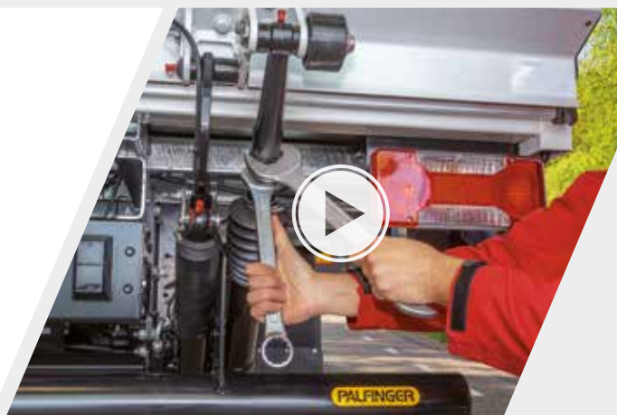
Hinweise zur Behebung des Fehlers, z.B. Videos