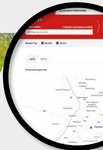
Anzeige des nächstgelegenen Servicepartners